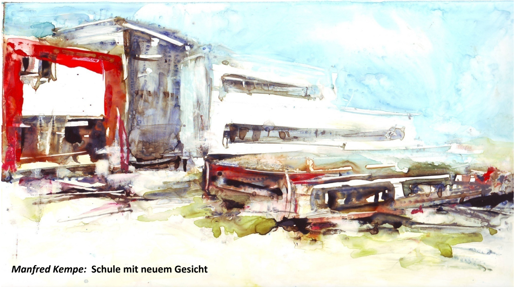
Manfred Kempe: Schule mit neuem Gesicht