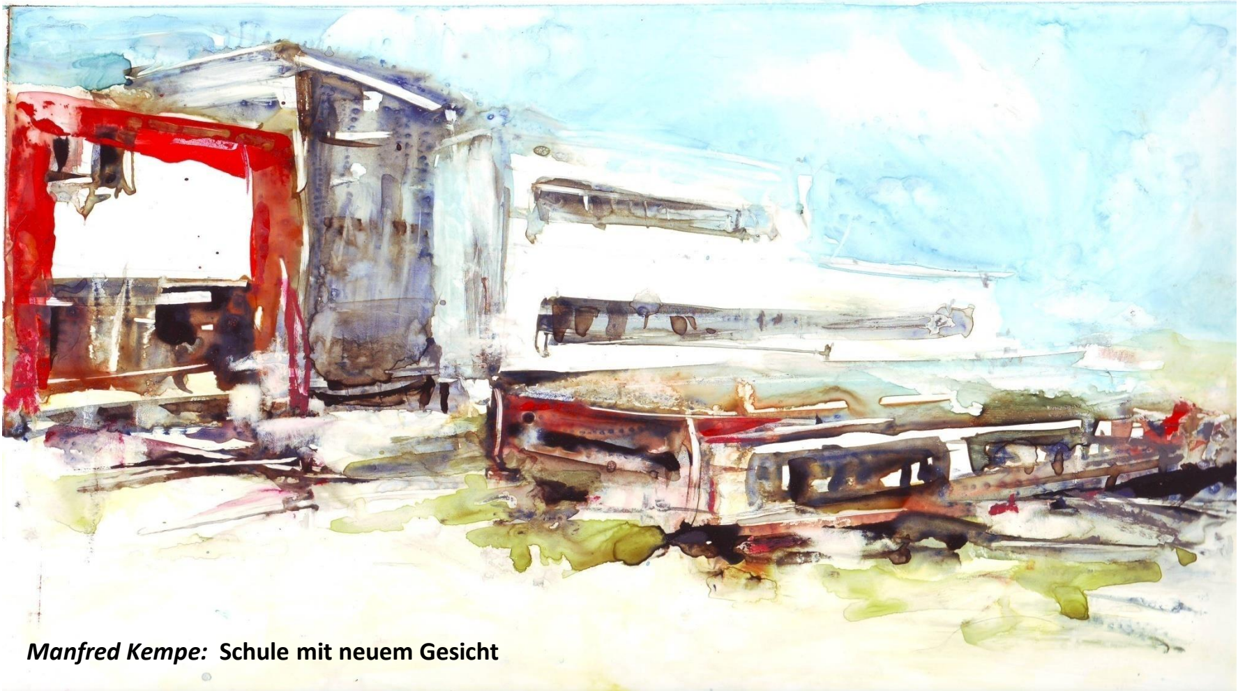
Manfred Kempe: Schule mit neuem Gesicht